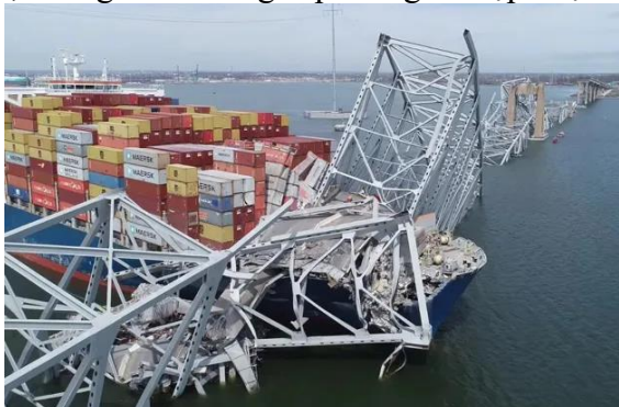
Vụ sập cầu Francis Scott Key hôm thứ Ba.